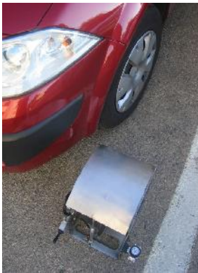
Bumper-On © זגם